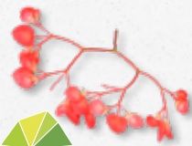
Apple Blossom Smak kwaśny, zielone jabłko