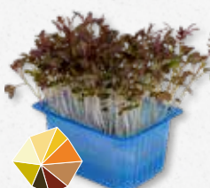
Kyona Mustard Cress