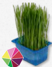
Wheat Grass Silny, słodkawy 5)