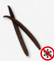
Planifolia Black - Vanilla

Skóra, przyprawy, orzechy, ziemistość, drewno