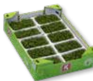
Rukiew ogrodowa (10x) Gorzycza, pieprzny, rzodkiewka