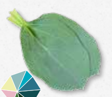
Oyster Leaves Kruczy ostryga