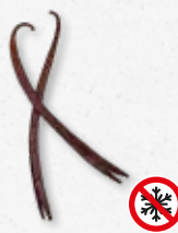
Planifolia Red - Vanilla

Vanilia (dodać aromaty wedle uznania) 1)