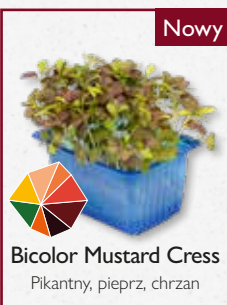
Bicolor Mustard Cress