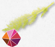
Feather Tops Świeży anyżu