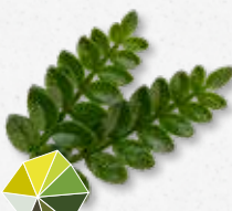
Sansho Leaves Owoce cytrusowe, yuzu, limonka kaffir