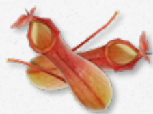
Venus Vase Niejadalna 9)