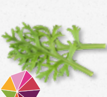
Kikuna® Leaves Marchew, seler