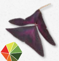
Yka Leaves® Kwaśny z lekko słodkim posmakiem