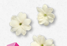
Jasmine Blossom Aromatyczny, jaśminu