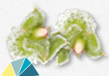
BlinQ Blossom® Świeży, solanka, sól