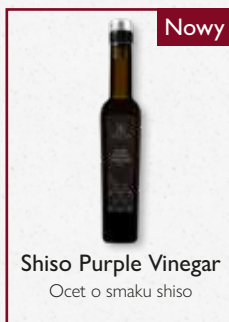
Shiso Purple Vinegar

Skóra, przyprawy, orzechy, ziemistość, drewno