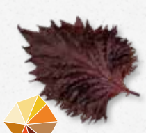
Shiso Leaves Purple Kumin