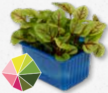
Vene Cress Kwaskowaty