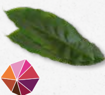
Cardamom Leaves Cynamonowy, drzewny, lekko słodki