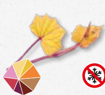
Sweet Peeper Lekko gorzki, słodki