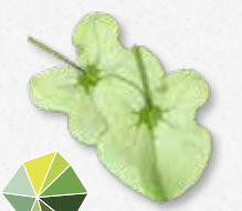
Syrha Leaves® Odświeżający kwaśny