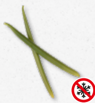
Planifolia Green - Vanilla

Vanilia (dodać aromaty wedle uznania) 1)