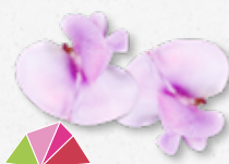
Bean Blossom Młoda fasolka