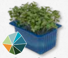
BroccoCress® Rauwe broccoli