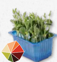
Lupine Cress Stevige bite, licht bitter, frisse bonen, knapperig 3)