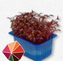
Scarlet Cress Milde rode biet