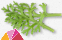
Kikuna® Leaves Wortel, selderij