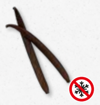
Planifolia Black - Vanilla Leer, specerij, noten, aards, hout