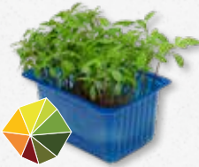
Aclla Cress® Fris, munt, citrus