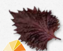
Shiso Leaves Purple Komijn