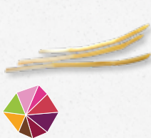
Sweet Lov Zoet