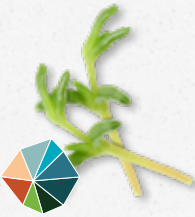
Salty Fingers® Ziltig, knapperig, licht bitter