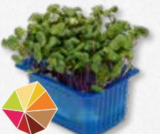
Chilli Cress Scherpe mosterd