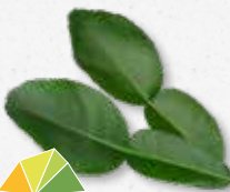
Kaffir Lime Leaves Zoete citrus, limoen