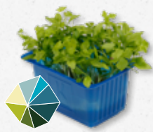
Persinette® Cress Peterselie