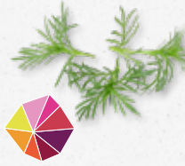
Pazitzz Tops® Zoet, anijs