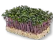
Purperkers (10x SinglePack) Kool