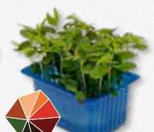
Tahoon® Cress Beukennotjes, paddenstoel, truffel