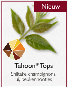
Tahoon® Tops Shiitake champignons, ui, beukenootjes