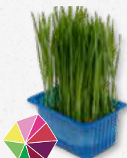
Wheat Grass Sterk zoet 5)