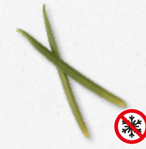
Planifolia Green - Vanilla Vanille (smaak naar eigen invulling) 1)