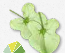
Syrha Leaves® Frisuur