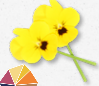
Cornabria Blossom® Frisse voorjaarsmaak