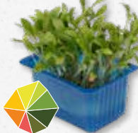
Ghoa Cress® Citrus, milde koriander