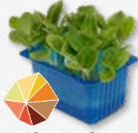
Borage Cress Zilt, oester, komkommer