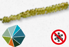
Moai Caviar Ziltig, waterig, gel-achtig