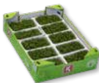
Tuinkers (10x) Mosterd, pittig, radijs