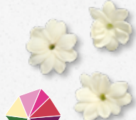
Jasmine Blossom Aromatisch, jasmijn