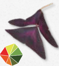
Yka Leaves® Zuur, licht zoet