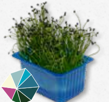
Rock Chives® Milde knoflook