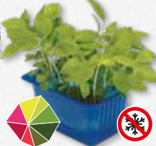
Limon Cress Limoen, anijs