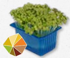
Mustard Cress Mierikswortel, wasabi 1)