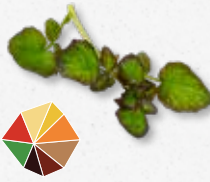
Hippo Tops Pittige waterkers