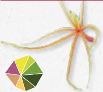
Aikiba® Leaves 6) Gel-achtig, licht zoet-zuur