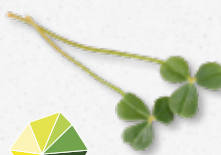
Citra Leaves® Friszure citrus tonen