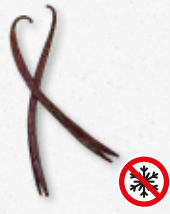
Planifolia Red - Vanilla Bloemig, fris, rood fruit, butterscotch