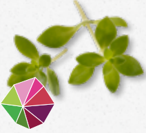
Gangnam Tops Fris, licht bitter