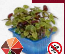
Shiso Bicolor Munt, basilicum, komijn