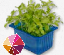
Honey® Cress Honingzoet