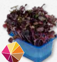
Sakura® Cress Radijs, rammenas