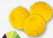
Sechuan Buttons® Tintelend, elektrisch, verdovend