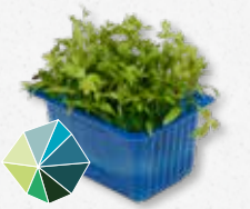
Motti Cress Aromatisch, selderij, maggiplant (lavas)