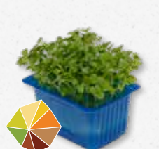
RucolaCress® Noten 1)