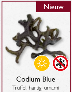
Codium Blue Truffel, hartig, umami