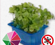
Shiso Green Munt, anijs