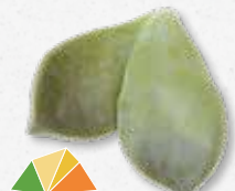
Majii® Leaves Sappig en knapperig blad