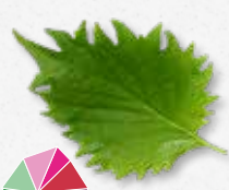
Shiso Leaves Green Munt, anijs