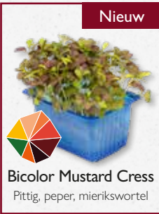
Bicolor Mustard Cress Pittig, peper, mierikswortel