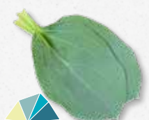
Oyster Leaves Ziltig, oester