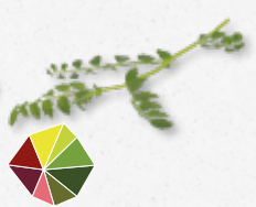
Hummus Leaves Kikkererwten