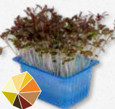
Kyona Mustard Cress Milde mosterd 1)