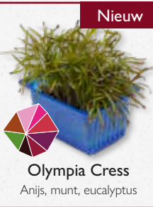
Olympia Cress Anijs, munt, eucalyptus