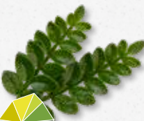
Sansho Leaves Citrusvruchten, yuzu, kaffir lime