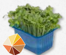
Daikon Cress® Rettich, rammenas