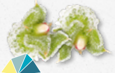
BlinQ Blossom® Fris, ziltig, zout