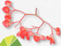
Apple Blossom Frisuur, groene appel