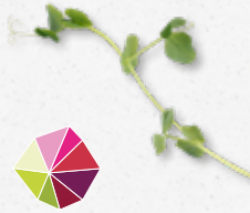
Spring Pea Verse doperwtten