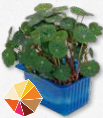
Zorri Cress Pittig, mierikswortel