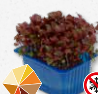
Shiso Purple Frisse komijn