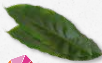
Cardamom Leaves Kaneel, houtachtig, licht zoet