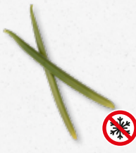
Planifolia Green - Vanilla Vaniglia (aggiungere aromi a piacere) 1)