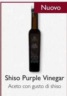
Shiso Purple Vinegar Aceto con gusto di shiso