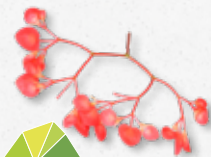
Apple Blossom Acidulo, mela verde