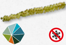
Moai Caviar Gelatinoso, acquoso, sapido