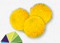
Sechuan Buttons® Frizzante, elettrico, intorpidente