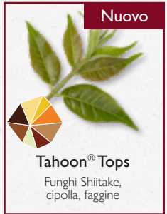
Tahoon® Tops Funghi Shiitake, cipolla, faggine