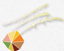
Talpa Shoots Leggermente amaro