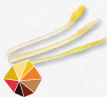
Morar Shoots Dolce-amaro, piccante