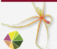
Aikiba® Leaves 6) Gelatina, leggermente agrodolce