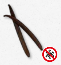
Planifolia Black - Vanilla Cuoio, spezie, noce, terroso, legno