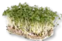
BroccoCress® (10x SinglePack) Broccoli crudi