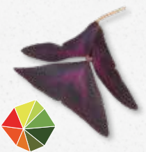
Yka Leaves® Acidulo