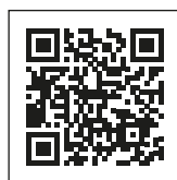
Scopri Koppert Cress online Scansiona il codice QR