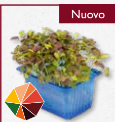
Bicolor Mustard Cress