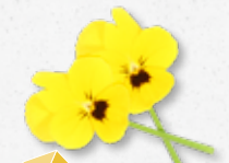
Cornabria Blossom® Fresco gusto di primavera