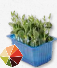
Lupine Cress Ligeramente amargo, haba fresca, crujiente 3)