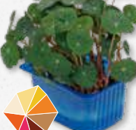
Zorri Cress Picante, raifort