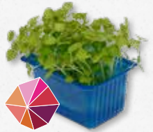
Atsina® Cress Anís dulce, regaliz