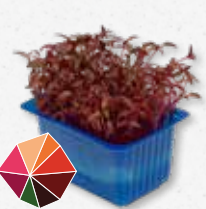
Scarlet Cress Remolacha suave