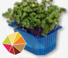
Chilli Cress Picante, mostaza