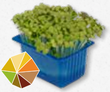
Mustard Cress Raifort, wasabi 1)