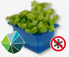
Basil Cress Albahaca