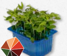
Tahoon® Cress Nueces de haya, setas, trufas