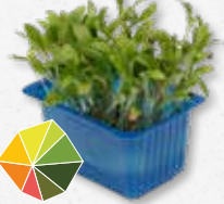
Ghoa Cress® Cítrico, cilantro suave