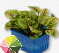
Vene Cress Ligeramente ácido