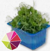
Affilla Cress® Guisantes frescos