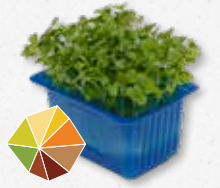
RucolaCress® Nueces 4)