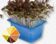
Kyona Mustard Cress Mostaza suave 1)