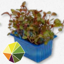
Adjí Cress Pimienta negra