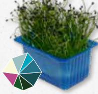
Rock Chives® Ajo tierno