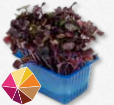
Sakura® Cress Rábano, rábano negro