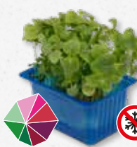
Shiso Green Menta, anís