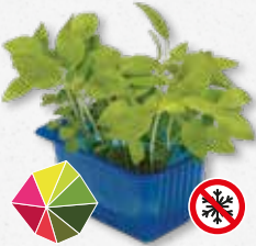
Limon Cress Lima, anisado