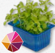
Hony® Cress Dulce, miel