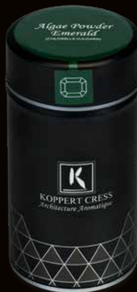
Algae Powder Emerald (Chlorella Vulgaris)

Deze algenpoeder is van de Chlorella-familie en werd voor het eerst ontdekt in de grachten van Delft (Nederland) door M.W. Beijerinck in 1889. Er zijn meer dan honderd variëteiten van deze alg, waardoor het mogelijk is om specifieke soorten Chlorella te selecteren vanwege hun aromatische en visuele