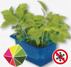
Limon Cress Limetta, anice