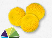
Sechuan Buttons® Frizzante, elettrico, intorpidente