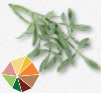
Sea Fennel Aromatico, piccante, asparagi