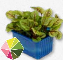
Vene Cress Leggermente acidulo