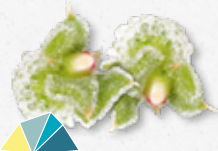
BlinQ Blossom® Fresco, salmastro, salato