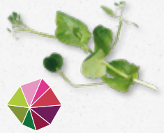
Salad Pea Gusto delicato di piselli