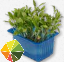
Ghoa Cress® Agrumi, coriandolo delicato