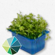
Motti Cress Aromatico, sedano, sedano di monte