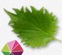
Shiso Leaves Green Menta, anice