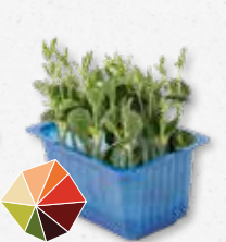
Lupine Cress Buono morso, amarognolo, fagioli freschi, croccante 2)