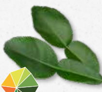
Kaffir Lime Leaves Agrumi dolci, limetta