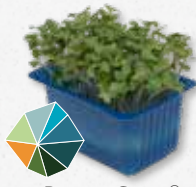
BroccoCress® Broccoli crudi