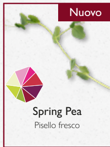
Spring Pea Pisello fresco