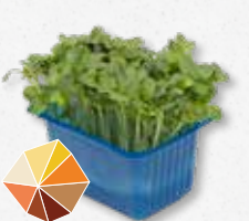
Daikon Cress® Ravanello giapponese, ravanello nero