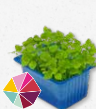
Melissa Cress Sapore di menta, profumo di limone