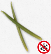
Planifolia Green - Vanilla Vaniglia (aggiungere aromi a piacere) 1)