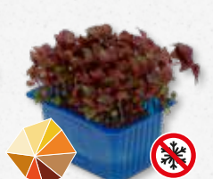
Shiso Purple Cumino fresco