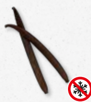
Planifolia Black - Vanilla Cuoio, spezie, noce, terroso, legno