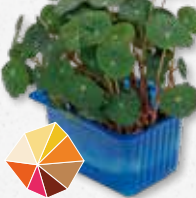
Zorri Cress Piccante, rafano