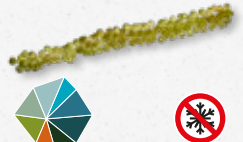
Moai Caviar Gelatinoso, acquoso, sapido