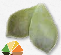
Majii® Leaves Foglie succose e croccanti