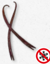
Planifolia Red - Vanilla Fiori, freschi, frutti rossi, butterscotch