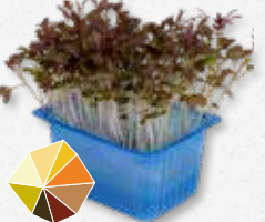
Kyona Mustard Cress Senape delicata 1)