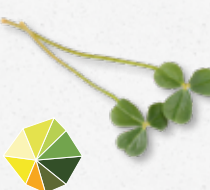
Citra Leaves® Toni di agrumi freschi e aspri