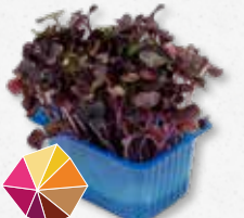
Sakura® Cress Ravanello, ravanello nero