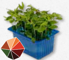
Tahoon® Cress Faggine, funghi, tartufo