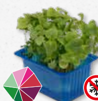
Shiso Green Menta, anice