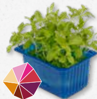
Hony® Cress Dolce miele