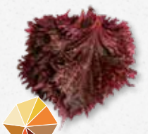
Shiso Leaves Purple Cumino