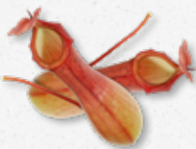
Venus Vase Non edule 6)