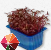
Scarlet Cress Bietola rossa, delicato